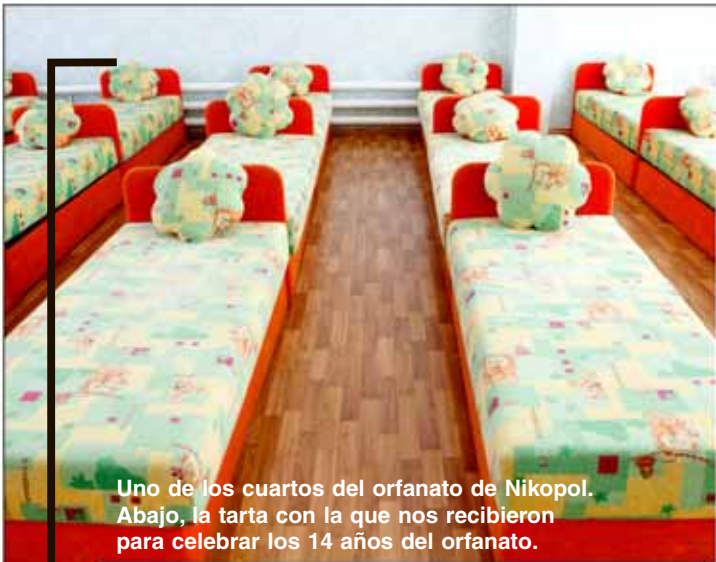
Uno de los cuartos del orfanato de Nikopol. Abajo, la tarta con la que nos recibieron para celebrar los 14 años del orfanato.